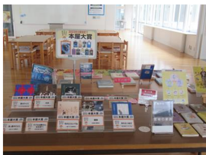
〈図書館の本屋大賞特集〉