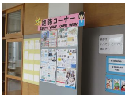
〈2学年進路コーナー〉